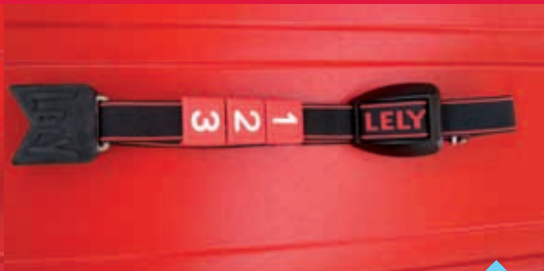
Lely Qwes-HR: Identifikasjon, brunstdeteksjon og måling av drøvtyggingsaktivitet.