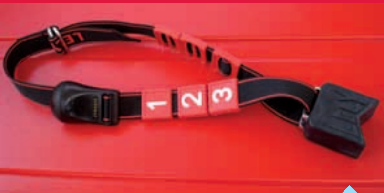
Lely Qwes-H: Identifikasjon og brunstdeteksjon.