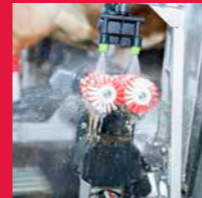
Saubere Duo-Effekt Bürsten