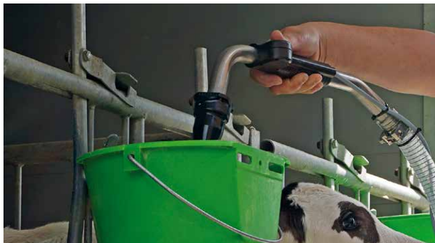
Egyszerű és könnyen használható adagolóegység