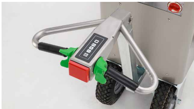
Vonófej beépített funkciógombokkal

A Lely Calm tejkiosztó kocsi alapkitelben keverővel, fűtéssel, tartálytisztító funkcióval, felhasználói felülettel, adagolás-vezérléssel, kétsebességű hajtásrendszerrel rendelkezik, és opcionálisan felszerelhető az alábbiakkal: LED-lámpa, vödörtartó, adagolókar, ciklontisztítás, lassú és gyors működésű keverő, hűtés, továbbá gomb az adagolópisztolyon a gyors adagolás érdekében.