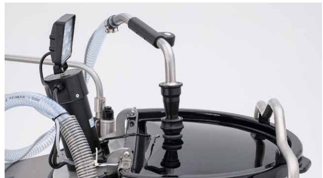
Adagolókar tisztítási helyzetben